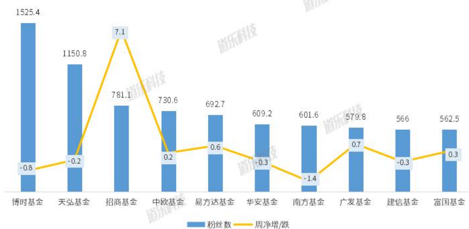
5.4-5.17基金公司蚂蚁财富号粉丝量TOP10及净增数 (单位：万)

5.4-5.17期间，TOP10基金公司财富号粉丝量排名状况变化幅度不大。在粉丝净增量上，TOP10家财富号粉丝量增速缓慢，只有招商基金粉丝量增量较大，博时基金、天弘基金、华安基金、南方基金、建信基金公司粉丝净增数呈现负增长。